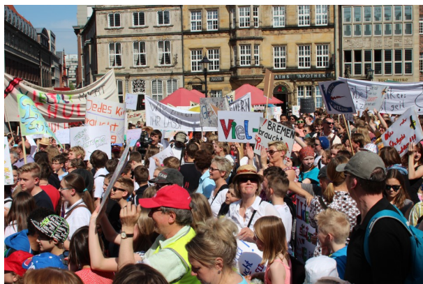
Demonstration auf dem Marktplatz gegen Kürzungen der staatlichen Zuschüsse

Außerordentliche Elternschulgelderhöhung wegen der gesunkenen staatlichen Zuschüsse und Anpassung des Schulgeldermäßigungsverfahrens durch den Schulträger. Erfreulicherweise melden kaum Eltern aus diesem Grund ihre Kinder ab.